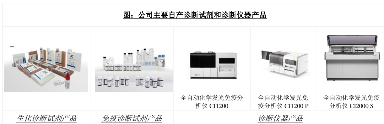
图：公司主要自产诊断试剂和诊断仪器产品

公司在生物化学原料领域产品包括生物酶、辅酶、抗原、抗体、精细化学品等各种试剂，应用范围涵盖生物科技、临床诊断和化工生产等多个方面。公司是国内极少数掌握诊断酶制备技术的诊断试剂生产企业之一。全资子公司阿匹斯通过借助利德曼多年积累的体外诊断行业渠道、国内各级医疗机构以及科研机构资源，可以服务于体外诊断、临床诊断与医疗、生命科学、食品检测等专业领域的企业、大学、科研院所。